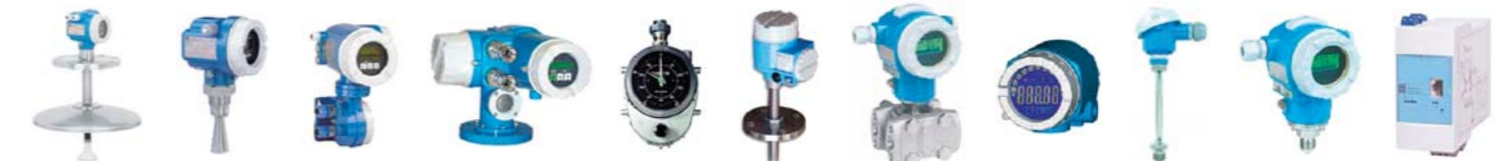
Micropilot S Micropilot M Promonitor Proservo Sakura Prothermo Deltabar iTemp Omnigrad Cerabar Fieldgate

Na meranie hladín sa najčastejšie používajú radarové snímače Micropilot, servohladinomery Proservo, plavákové snímače Sakura, tyčové alebo lanové radarové snímače Levelflex. Na stráženie hladín sa preferujú vibračné spínače Liquiphant pred kapacitnými sondami Multicap, nakoľko nové prístroje Endress + Hauser sa vyrábajú podľa požiadaviek SIL (Safety Integrity Level). Kapacitná sonda Multicap meria okrem hladiny aj rozhranie vody s ropným produktom. Podobné kapacitné sondy sú integrované aj do viacbodových snímačov teploty Prothermo, kde prevodník teploty vypočíta priemernú hodnotu len z tých nameraných bodov, ktoré sú pod hladinou, a dáva dodatočnú informáciu o výške hladiny vody pod ropným produktom. Na jednoduché meranie teploty v jednom alebo v dvoch bodoch stačí použiť prístroj Omnigrad alebo iTemp. Švajčiarsky koncern Endress + Hauser so svojimi viac ako 50-ročnými skúsenosťami dlhé roky vyrába špecializovanú poľnú inštrumentáciu a zariadenia System&Gauging pre priemyselné odvetvie „Oil&Gas“ (petrochémiie, rafinérie, plynárenský priemysel, transfer ropných produktov).