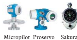
Micropilot Proservo Sakura