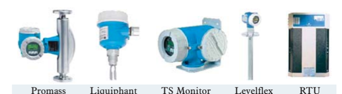
Promass Liquiphant TS Monitor Levelflex RTU