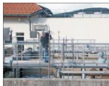
Obr. 3 Měření rozpouštěného kyslíku v německém pivovaru Rathaus

Čištění odpadní vody z pivovaru v německém Rathausu (obr. 3) se skládá z řady malých nádrží SBR (Single Batch Reactor), které jsou plněny ze sběrné a vyrovnávací nádrže poblíž pivovaru. Senzor je namontován na neohebné trubce, která se může pohybovat vertikálně v nádrži SBR. Obsah kyslíku je kontrolován tedy v konstantní vzdálenosti od vodní hladiny, protože správnost měření je podstatná pro kontrolu kvality. Při použití starších elektrochemických senzorů nemohou být provzdušňovací fáze detekovány v reálném čase, ale se zpožděním okolo 3 až 5 minut, což je zapříčiněno pronikáním kyslíku přes membránu k měřicímu čidlu. S optickým senzorem je proces daleko rychlejší, protože stačí, aby molekuly kyslíku byly v blízkosti citlivých senzorů. Výsledkem je větší množství vyčištěné odpadní vody za stejný čas nebo snížení nákladů na čištění.