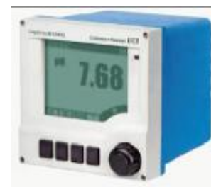
Obr. 1 Převodník Liquiline M je charakteristický zejména velkým displejem

Dvou vodičový převodník Liquiline M (obr. 1) je určen pro měření pH, oxidačně redukčního potenciálu, elektrolytické vodivosti, měrného odporu a koncentrace. Přístroj zpracovává, zobrazuje a předává měřené hodnoty ze senzoru. Při vývoji převodníku Liquiline M byla velká pozornost věnována zajištění snadné obsluhy. Proto je charakteristický zejména svým velkým displejem, který zobrazuje měřenou hodnotu v číslicemi vysokými 28 mm. V nabídkách určených pro obsluhu se používá běžný text (obr. 2). Převodník se obsluhuje pomocí moderních ovládacích prvků, jaké jsou na videopřístrojích nebo autorádiích. Uživatel může procházet nabídkami otáčením a stisknutím ovládacího tlačítka (navigator). Nedůležitější funkce jsou přístupné přímo pomocí kláves, kterým lze přiřadit různý význam (soft keys).