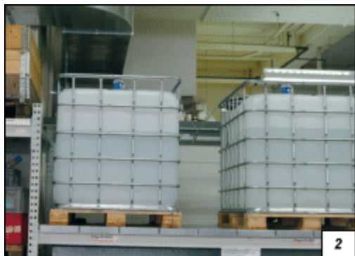
Obr. 2. Konstrukční uspořádání umožňuje použít hladinoměr Liquicap T FMI21 v nádobách libovolných tvarů z libovolných materiálů, včetně plastu

snímač snadno přizpůsobit např. změně technologických podmínek nebo je možné tuto vlastnost využít k optimalizaci skladových zásob snímačů.