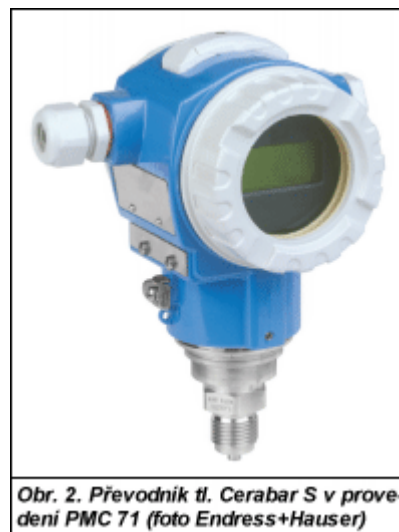
Obr. 2. Převodník tl. Cerabar S v provedení PMC 71

Vcelku nabízejí převodníky řady Cerabar S/Deltabar S měřicí rozsahy od úplného vakua až po tlak 70 MPa při přesnosti snímače standardně do \pm 0,075 . Jedinečným prvkem v konstrukci těchto převodníků je keramická kapacitní tlakoměrná dóza typu Ceraphire® s vestavěnou diagnostikou. Díky základnímu použitému materiálu, kterým je Al_2O_3 s čistotou 99,9 %, je dóza skutečně mimořádně odolná proti všem vlivům vyskytujícím se v průmyslových provozních podmínkách. Dóza Ceraphire odolává korozi i abrazi a neobsahuje absolutně žádný olej, takže je použitelná i k měření podtlaku. Pro větší teploty a tlaky je vedle keramické dózy k dispozici také kovová tlakoměrná dóza s piezoelektrickými citlivými prvky.