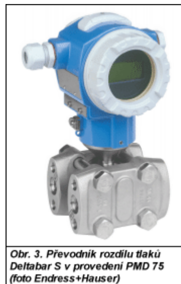
Obr. 3. Převodník rozdílu tlaků Deltabar S v provedení PMD 75

Jako celek jsou převodníky Cerabar S i Deltabar S vyvinuty, zkoušeny a vyráběny v souladu s normou IEC 61508 při záruce úrovně bezpečnosti SIL 2 ( Safety Integrity Level ). V provedeních s keramickou i kovovou tlakoměrnou dózou jsou k dispozici s certifikátem podle směrnice ATEX, dovolujícím použít je v prostředí s nebezpečím výbuchu.