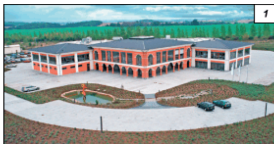
Obr. 1. Závod společnosti Endress+Hauser Conducta ve Waldheimu

U pitné a odpadní vody, stejně jako u různých chemikálií a farmaceutických substancí je nutné trvale sledovat jejich kvalitu. Použití zde proto nacházejí různé přístroje pro analýzu kapalin. Jedním z vedoucích dodavatelů této techniky je společnost pro měřicí a regulační techniku Endress+Hauser Conducta GmbH+Co. KG se sídlem v Gerlingenu v Německu, která se díky své schopnosti vystihnout potřeby trhu a uživatelů během necelých třiceti let rozvinula z malé provozovny ve firmu s celosvětovou působností.