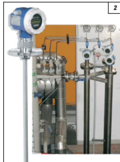
Obr. 2. Hladinoměr Levelflex M a příklad jeho instalace v elektrárenském provozu

Hladinoměry Levelflex M nerozlišují mezi měřením kapalných a pevných látek. Je pravda, že pracovníci v provozech při obsluze tlakových nádob, nádrží, zásobníků a sil s ocelovými tyčemi, dráty nebo lany instalovanými uvnitř často trpí tísnivými pocity. Není se však čeho obávat a tudíž ani přijímat zvláštní opatření. Ocelový drát i lano jsou pružné a nepoškodí je ani hrubé kusy pevného materiálu v zásobníku. Důkazem je každodenní provoz tisíců zásobníků v cementárnách, kamenolomech a dolech po celém světě. Žádný významnější vliv nemá ani kal nebo bláto ulpělé na vodicí tyči. Nejistota měření v nejhorším případě naroste o několik málo milimetrů. Odpovídající přesné zpracování frekvenčního signálu v přístroji umožňuje umístit v jedné nádrži velmi blízko vedle sebe několik hladinoměrů Levelflex, aniž by hrozilo nebezpečí přeslechů. Lze tak snadno realizovat redundantní měřicí řetězce nutné např. pro odlehčovací nádrže. Výhodné je i to, že hladinoměr Levelflex M může být umístěn velmi blízko