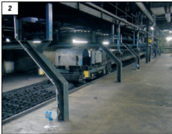
Obr. 2. Provozní zásobník uhlí v elektrárně ve Veltheimu

Pro zajištění nepřetržitého chodu elektrárny je mj. nezbytné zabezpečit bezchybné měření úrovně (polohy) hladiny uhlí v provozních zásobnících u kotlů, na dopravních pásech (obr. 3) a při sledování hald na skládce. Přitom hladina uhlí v provozním zásobníku nikdy nesmí poklesnout pod určitou minimální úroveň, aby nemohlo dojít ke zpětnému toku vzduchu z mlýna do zásobníku, a tím ke vzniku výbušné směsi uhelného prachu se vzduchem. Provozní zkušenosti s prvními novými bezkontaktními radary Micropilot M FMR250 jsou v elektrárně ve Veltheimu natolik dobré, že zde byl k řešení mnoha různých úloh postupně nainstalován větší počet přístrojů této řady. Potvrzuje to Franz Edel z firmy Gemeinschaftswerk Weser GmbH v Porta Westfalica, který je vedoucím projektu