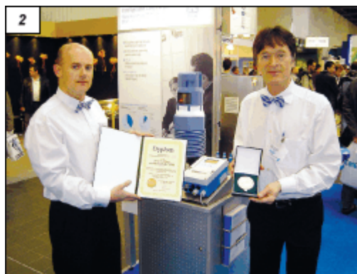
Obr. 2. Ve Varšavě získal systém Memosens ocenění Zlatý medal Automaticon 2005

I přes zcela zřejmé technické a snadno vyčíslitelné ekonomické přínosy tento exponát nedosáhl na Zlatou medaili MSV a skončil v soutěži pouze jako nominovaný. O to cennější je Cena redakce časopisu Technika a trh, kterou systém Memosens vloni na MSV získal a která správně předpověděla nadšenou reakci uživatelů. Jinak tomu bylo v sousedním Polsku, kde na prestižním veletrhu Automaticon ve Varšavě v dubnu 2005 získal systém Memosens ocenění nejvyšší – Zlatý medal Automaticon 2005 (obr. 2). Oceněno bylo inovační řešení, komerční dostupnost produktu, počet již instalovaných kusů a referencí z okolních zemí (podstatná část právě z České republiky).