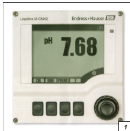
Obr. 1. Převodník Liquiline M CM42 v provedení s pouzdem z odolného plastu

Někdy konstruktéři vědí hned na začátku, že posouvají úroveň techniky nejen o krok, ale přímo o celý skok dopředu. A přesně to byl případ nového převodníku řady Liquiline M – přístroje, který současně zpracovává měřicí signál ze snímače, zobrazuje naměřené hodnoty, sleduje je a předává je k dalšímu využití. „Začali jsem v tomto případě s něčím zcela revolučním,“ je přesvědčen Axel Tischendorf, který má tento výrobek u firmy Endress+Hauser na starosti. „Pokud jde o jednoduchost a všestrannost použití, vyvolá tento přístroj zcela jistě velmi živý zájem zákazníků,“