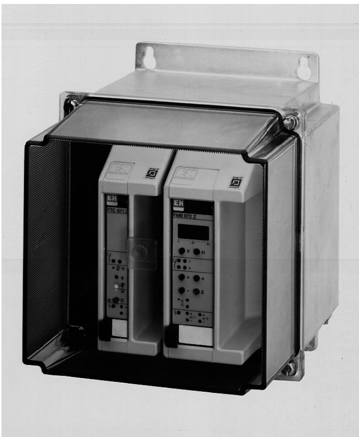
Znázorněná skříň Mono- rack v tomto případě ob- sahuje jedno pouzdro 4 HP Monorack a jedno 7 HP Monorack